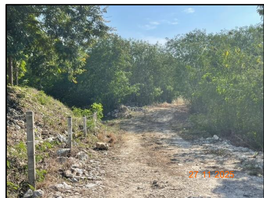
รูปที่ 2-16 ถนนภายในพื้นที่โครงการ