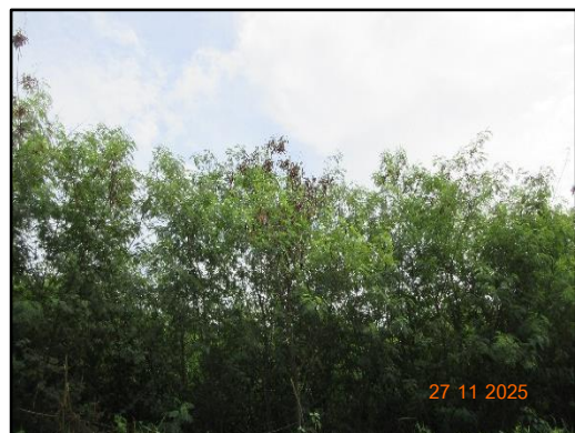
รูปที่ 2-14 สภาพต้นไม้อยู่ตามธรรมชาติโดยรอบพื้นที่โครงการ (ป่าเหมืองข้างเคียง)