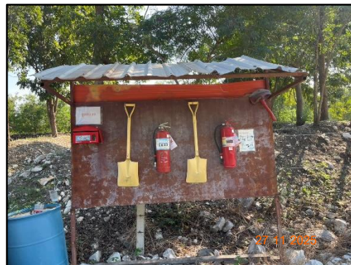
รูปที่ 2-6 ป้ายเตือนเขตการใช้วัตถุระเบิดที่สามารถมองเห็นได้อย่างชัดเจน