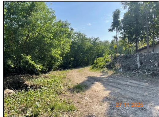
รูปที่ 2-1 การเว้นพื้นที่ไม่ทำเหมืองให้ห่างจากเส้นทางสาธารณประโยชน์ทางด้านทิศตะวันตก