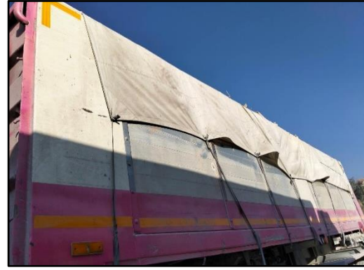
รูปที่ 2-11 รถบรรทุกขนส่งแร่ที่ปิดคลุมผ้าใบอย่างมิดชิด