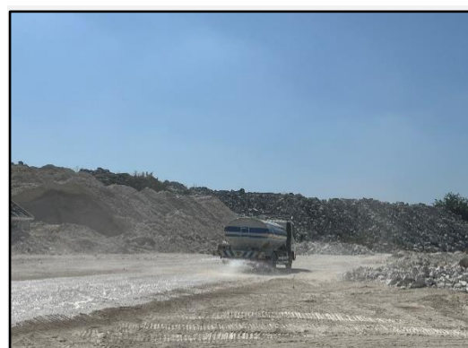
รูปที่ 2-10 การฉีดพรมน้ำบริเวณที่เกิดฝุ่นละออง ทั้งบริเวณหน้าเหมือง และเส้นทางขนส่งภายในพื้นที่ เพื่อลดการฟุ้งกระจายของฝุ่นละออง