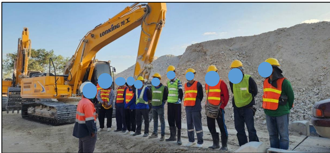
รูปที่ 2-12 พนักงานสวมใส่อุปกรณ์ป้องกันอันตรายส่วนบุคคลขณะปฏิบัติงาน