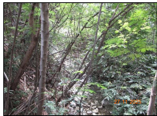
รูปที่ 2-2 ทางน้ำสาธารณะทางด้านทิศตะวันออก