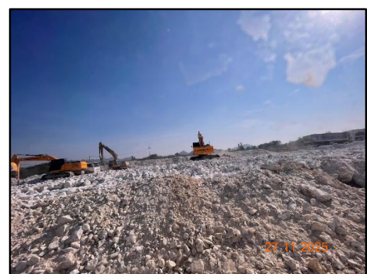
รูปที่ 2-5 สภาพหน้าเหมืองในปัจจุบันของโครงการ