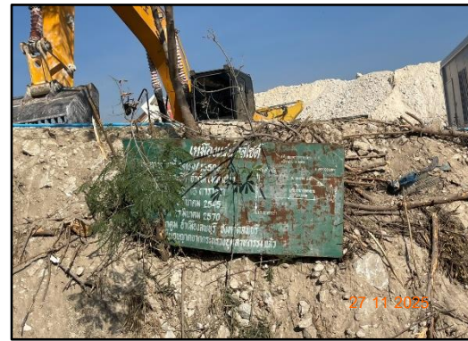
รูปที่ 2-15 ป้ายแสดงข้อมูลรายละเอียดเกี่ยวกับอายุประทานบัตรของโครงการ