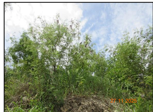
รูปที่ 2-4 การปลูกต้นไม้บริเวณพื้นที่เว้นการทำเหมือง