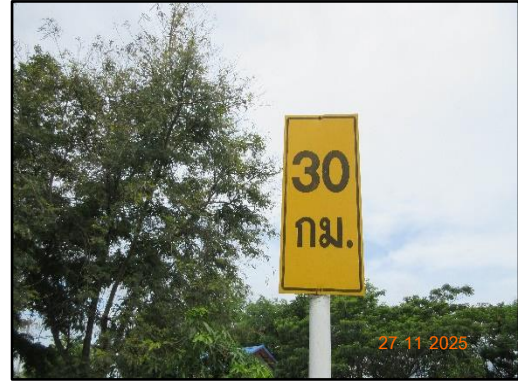
รูปที่ 18 ป้ายแจ้งเตือนความเร็วของรถขนส่งแร่ ระบุความเร็วไม่เกิน 30 กิโลเมตรต่อชั่วโมง