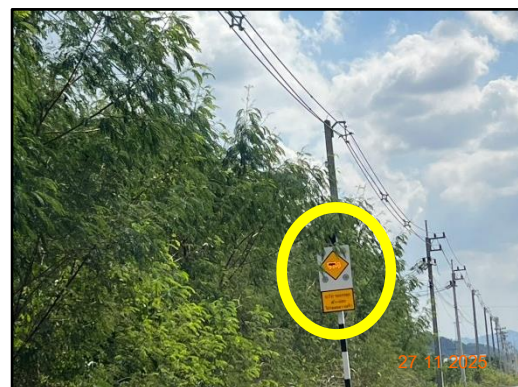
รูปที่ 17 สัญญาณไฟกระพริบ บริเวณริมเส้นทางขนส่งแร่